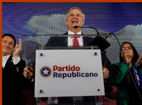
Chile - Informe post electoral Consejo Constitucional