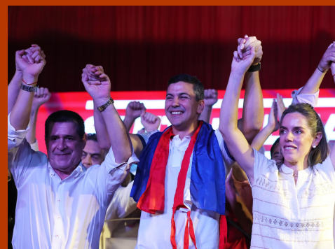
Paraguay - Informe post electoral