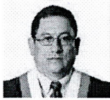
20. VIVANCO REYES, MIGUEL ÁNGEL (Fuerza Popular)