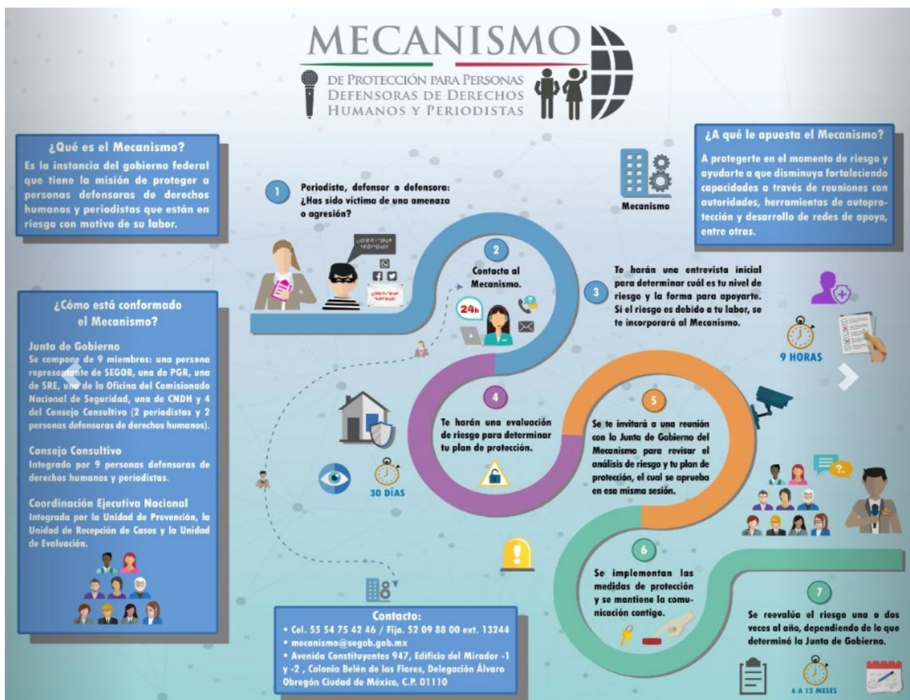
14 Gráfica 3: Mecanismo de protección para personas defensoras de derechos humanos y periodistas.

Su funcionamiento puede sintetizarse de la siguiente manera: