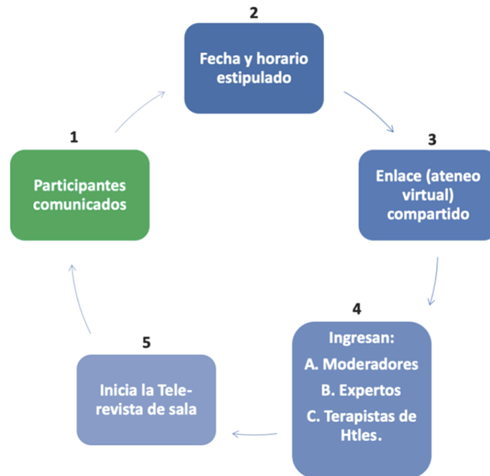
Esquema simplificado del proceso.