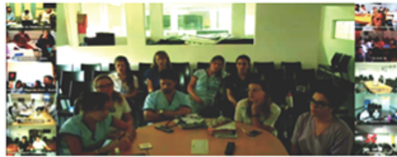
Imagen del encuentro en tiempo real.