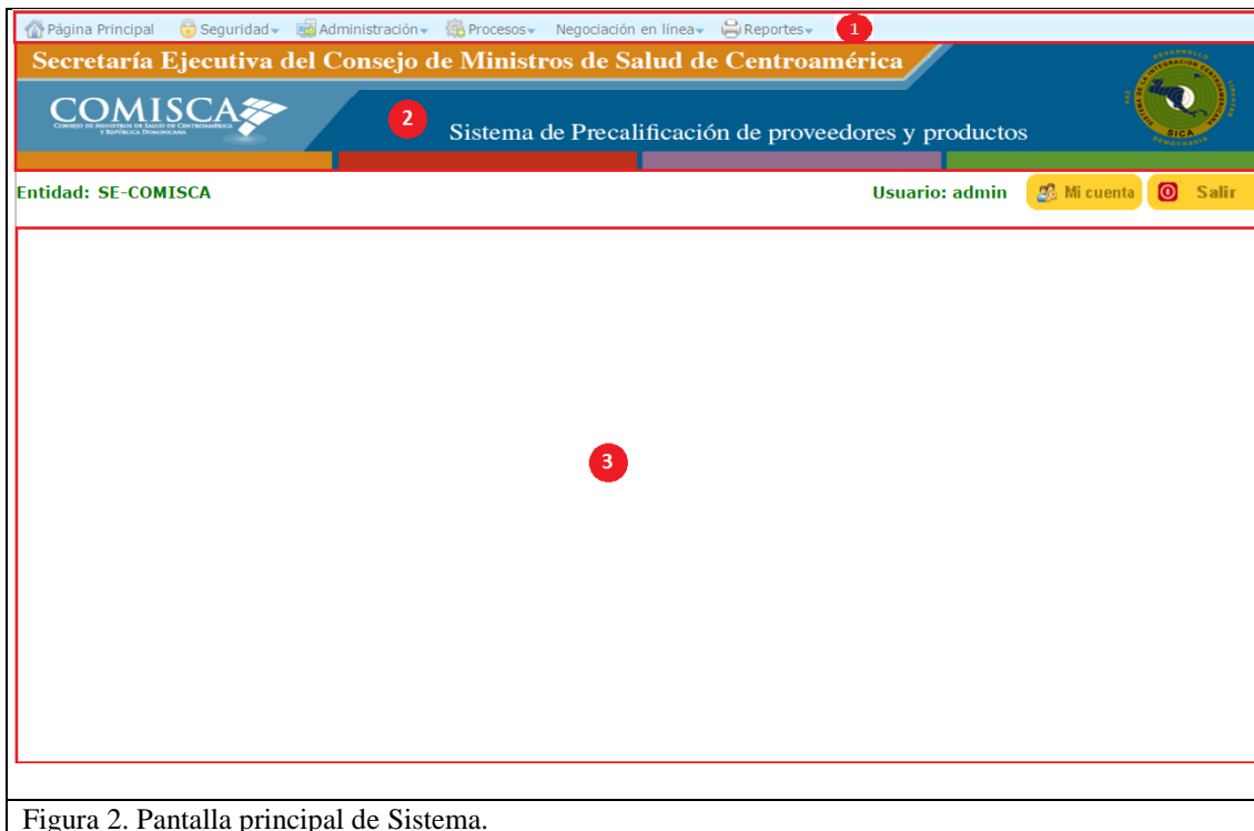
Figura 2. Pantalla principal de Sistema.

Luego de proporcionar las credenciales de ingreso (cuenta de usuario y contraseña) y que el sistema corrobore que son válidas nos aparecerá la siguiente pantalla: