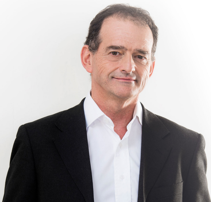
Guido Manini Ríos

Queremos mirar al futuro con esperanza, contribuir a la felicidad pública y devolver la confianza de los orientales en la política, para seguir escribiendo las mejores páginas de nuestra historia.